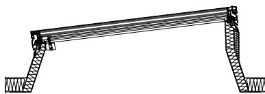
SKYSIGHT na podsadu se 7° sklonem ISO-THERM