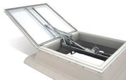
Světlíková kopule JET TOP-90 PLUS s 24V otevíracím mechanismem RWA, namontovaná na podsadě JET

Upozornění: Přestavbu JET TOP-90 na JET TOP-90 PLUS lze dodatečně provést